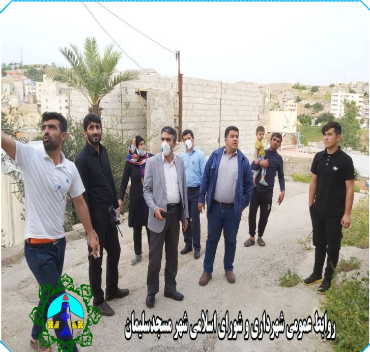
بازدید شهردار مسجدسلیمان از منطقه مالجونگی

وی ادامه داد: یکی از تعهدات مهم مجری این طرح و پیمانکار آن، اجرای کار به صورت بخش به بخش بوده است که می بایست پس از اجرای آن به صورت کامل توسط پیمانکار روکشی آسفالت اجرا میگردد ضمن اینکه طبق توافقات صورت گرفته مقرر گردید پیمانکار جاده مالکریسم را بعنوان جاده جایگزین ترمیم کند و کانال دفع آبهای سطحی پیچ مین آفیس را به طور کامل اجرایی نماید اما هیچ کدام از این تعهدات در عمل تحقق نیافت.